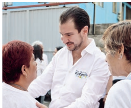
table a las colonias, y mejorar los servicios de bacheo, alumbrado y mantenimiento de vialidades, calles y jardines, por mencionar algunos.

Por ello, reitera que desde el Congreso mexicano se gestionarán y se conseguirán los recursos necesarios para fortalecer la seguridad de Naucalpan, para abastecer de agua po-